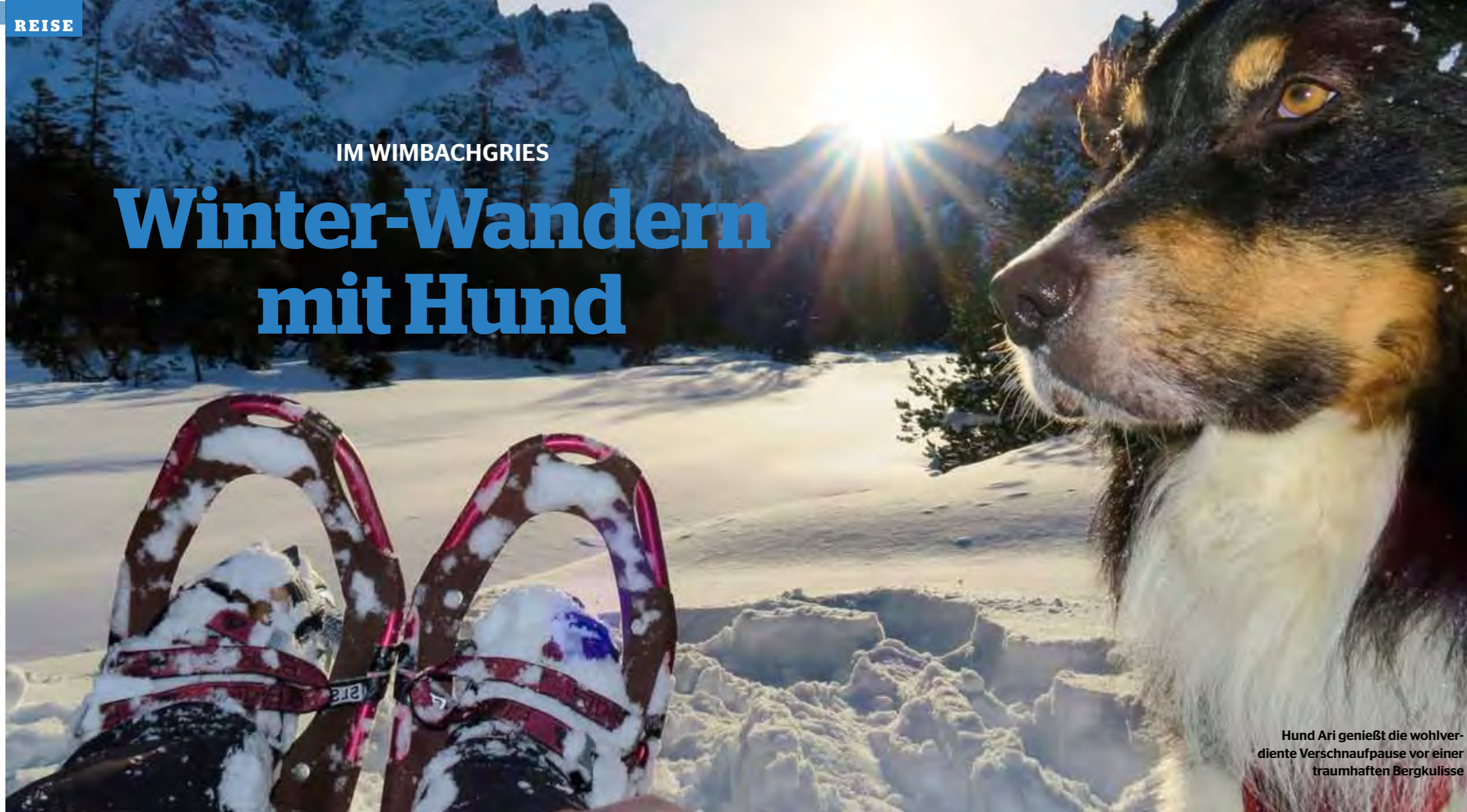
Hund Ari genießt die wohlverdiente Verschnaufpause vor einer traumhaften Bergkulisse