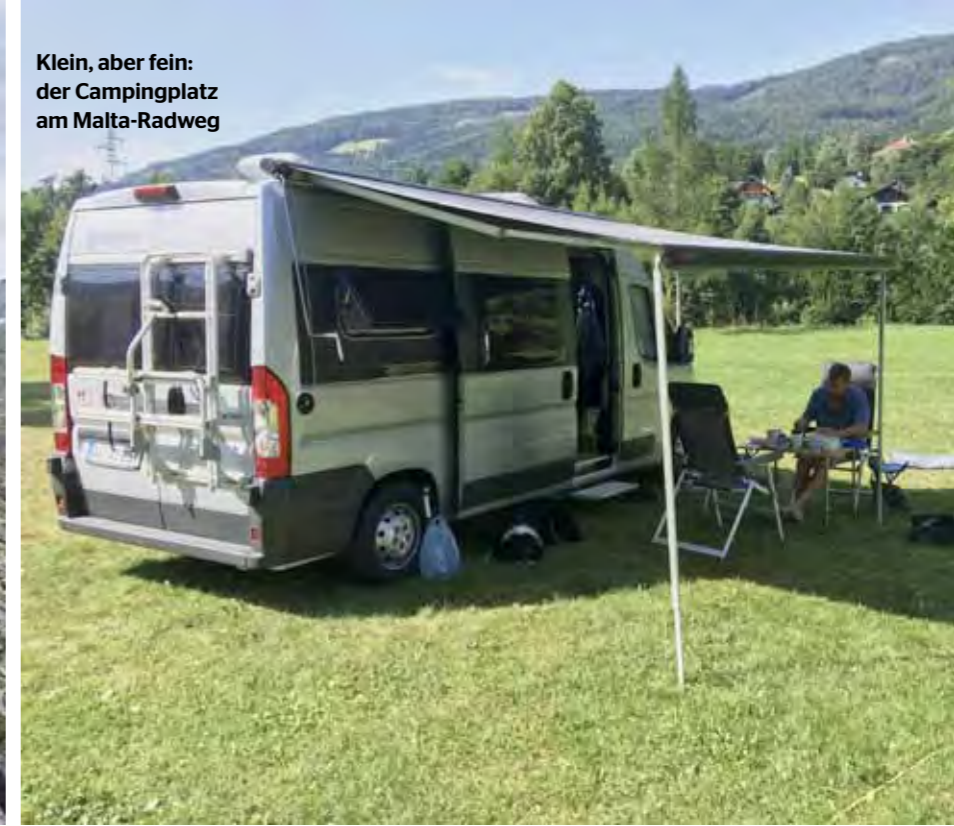
Klein, aber fein: der Campingplatz am Malta-Radweg

Wasser springen und Pause machen. Wir radelten Richtung Malta-Ort, entdeckten auf der Strecke schon ein paar versteckte Badeplätze direkt am Fluss mit dickem Flusssand als „Liegewiese“, die wir uns für den nächsten Tag vormerkten.