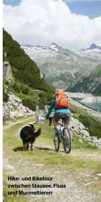
Hike- und Biketour zwischen Stausee, Fluss und Murmeltieren

Weitere, empfehlenswerte Wanderungen sind der Wassergedankenweg an den Gössfällen, der sich direkt an der so-