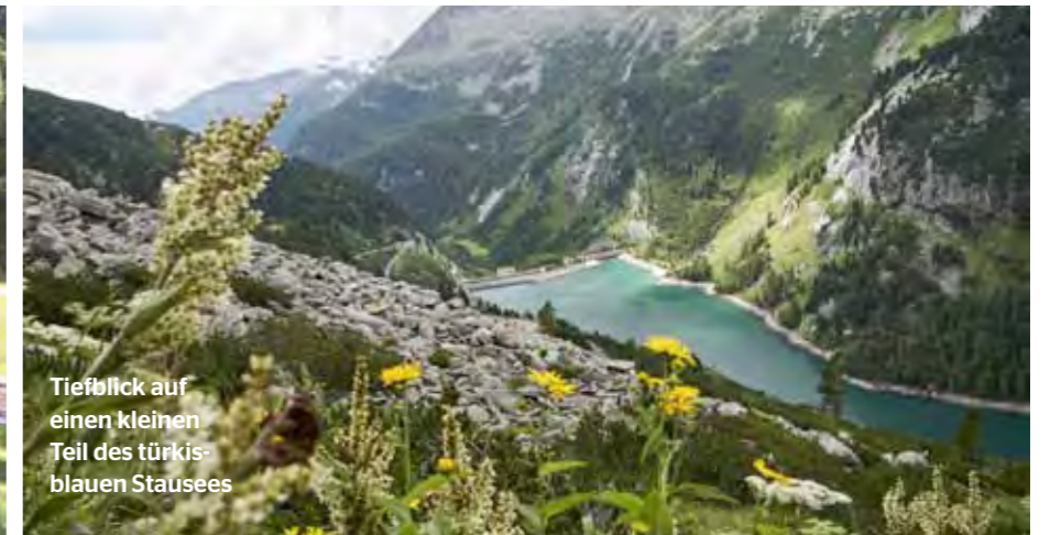
Tiefblick auf einen kleinen Teil des türkisblauen Stausees