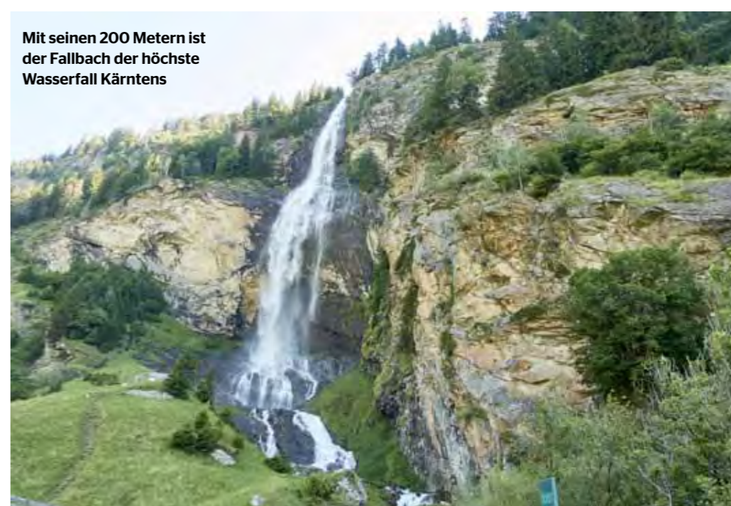
Mit seinen 200 Metern ist der Fallbach der höchste Wasserfall Kärntens