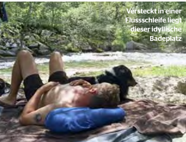
Versteckt in einer Flussschleife liegt dieser idyllische Badeplatz