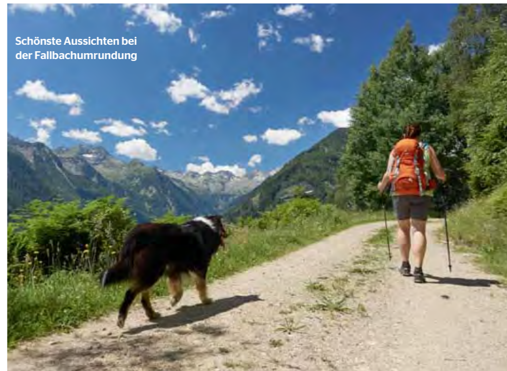
Schönste Aussichten bei der Fallbachumrundung