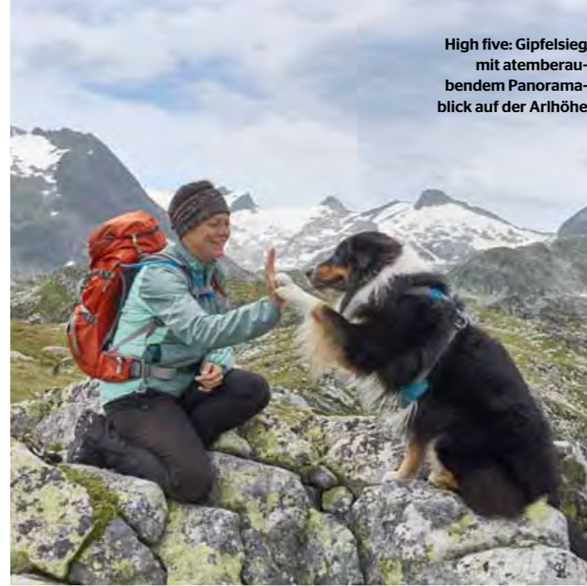
High five: Gipfelsieg mit atemberaubendem Panoramablick auf der Arlhöhe