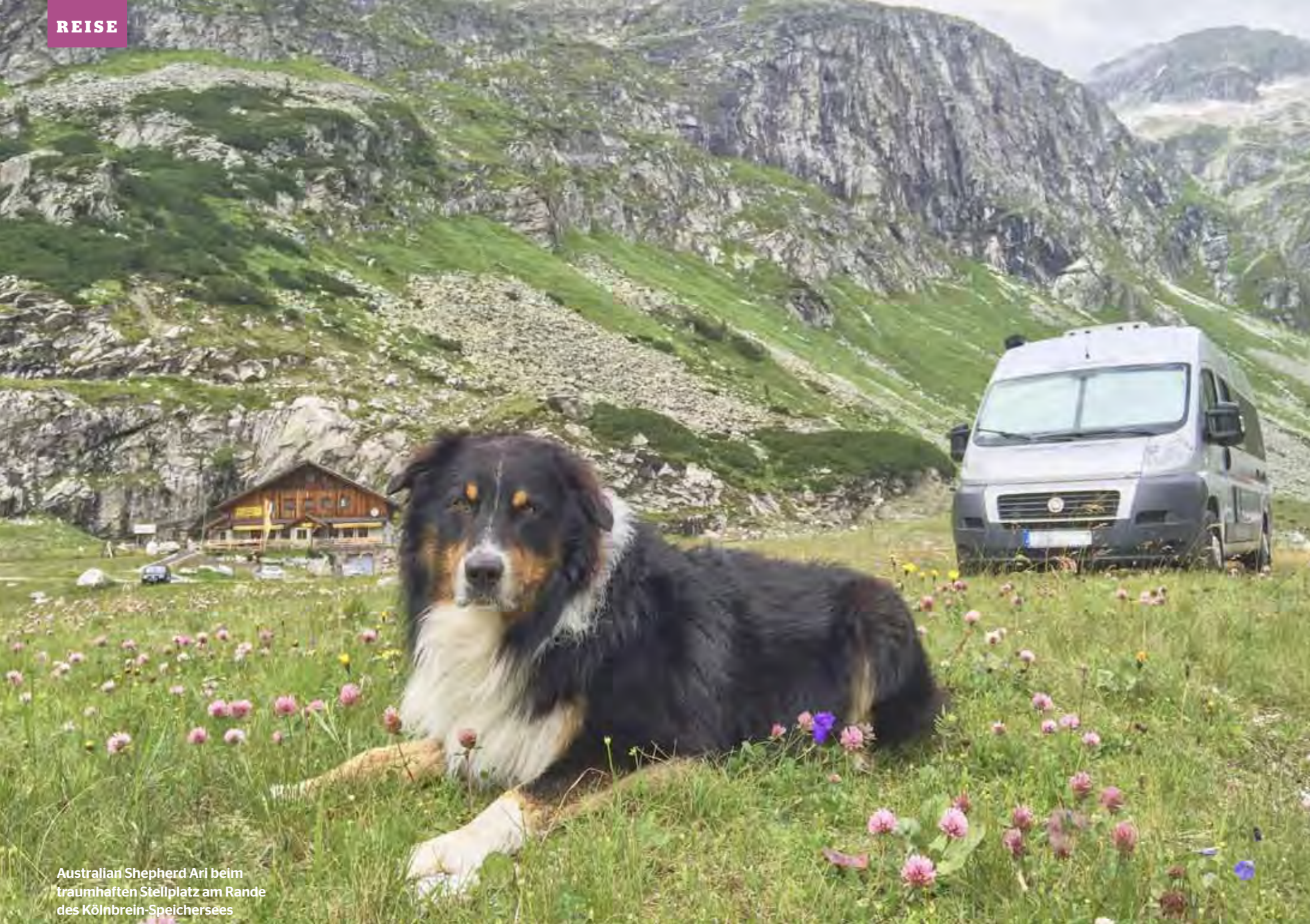
Australian Shepherd Ari beim traumhaften Stellplatz am Rande des Kolnbrein-Speichersees